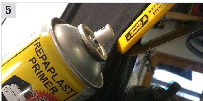
5 Dünne Schicht Repaplast Primer (Kunststoff-Haftvermittler) auf das Verdeck aufsprühen (ca. 10 Min. ablüften lassen).