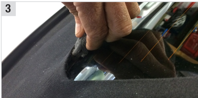
3 Das Verdeck mit Shine P 600 (Schleifvlies) aufrauen.