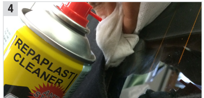
4 Nochmals mit Repaplast Cleaner Antistatic (Kunststoff-Reiniger) und Multi Wipes (Universaltuch) gut reinigen (ca. 5 Min. ablüften lassen).