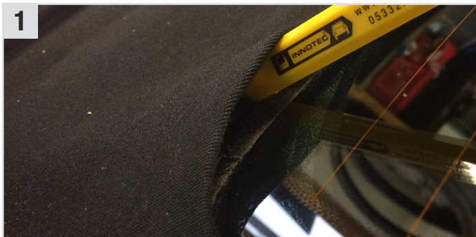
1 Eventuelle Rückstände mit dem Cuttermesser vorsichtig entfernen.