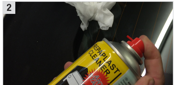
2 Anschließend mit Repaplast Cleaner Antistatic (Kunststoff-Reiniger) und Multi Wipes (Universaltuch) gut reinigen (ca. 5 Min. ablüften lassen).