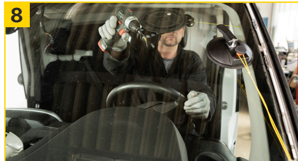
8 Akkuschauber auf Spule platzieren und langsam nach rechts laufen lassen (Drehzahl anpassen).