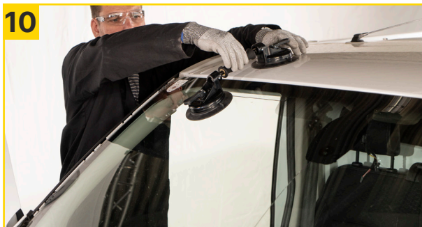
10 Scheibe mit Doppelsaughebern fixieren.