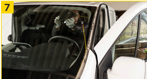
7 Austrennwerkzeug Fiber Cut-Out links oben positionieren und Vakuumpumpe betätigen bis der rote Sicherheitsring nicht mehr sichtbar ist.