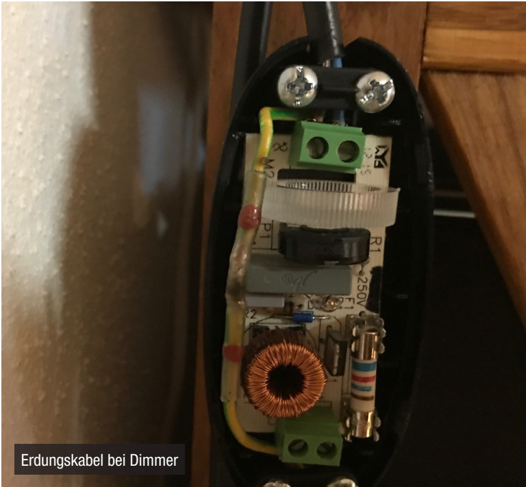
Erdungskabel bei Dimmer