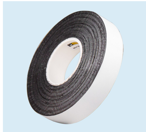
10 lfm Rolle