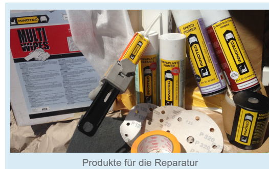
Produkte für die Reparatur