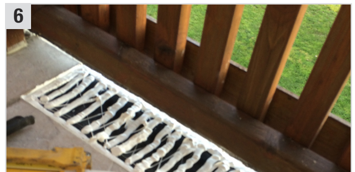
6 Adheseal (Streichbare Klebedichtmasse) auf die EPDM-Folie auftragen.