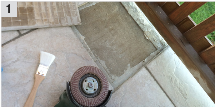
1 Alten Fliesenkleber und beschädigte EPDM-Folie entfernen.