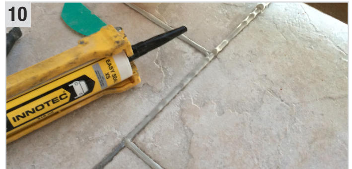
10 Beschädigte Fugen mit Easy Seal XS (Universelle Polymer-Dichtmasse) erneuern.