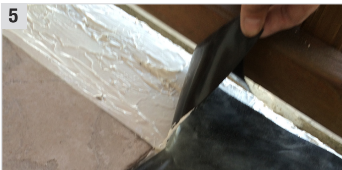
5 Neue EPDM-Folie aufkleben und anschließend gut andrücken.