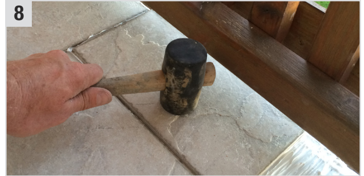
8 Fliesen wieder einsetzen.