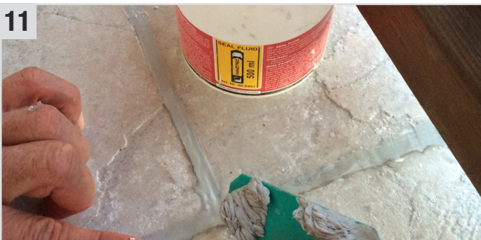
11 Mit Seal Fluid (Glättmittel) abglätten und mit einer Fugenschachtel abziehen.