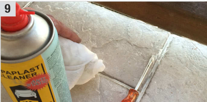
9 Überschüssiges Material mit Repaplast Cleaner Antistatic (Kunststoff-Reiniger) und Multi Wipes (Universaltuch) entfernen.