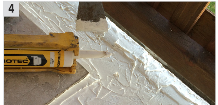
4 Versabond (Abtupfbare Dichtmasse) mithilfe der Easy Grip Gun (Kartuschenpistole) auf den Untergrund auftragen und anschließend mit einer Spachtel gleichmäßig verteilen.