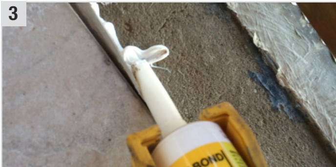
3 Alte Folie mit Versabond (Abtupfbare Dichtmasse) und Easy Grip Gun (Kartuschenpistole) abdichten/verkleben.