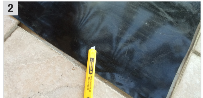
2 Neue EPDM-Folie entsprechend zuschneiden.