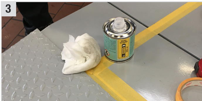
3 Seal Guard (Transparenter Primer) auf Multi Wipes (Universaltuch) geben und eine dünne Schicht auftragen - ca. 15 Min. ablüften lassen.