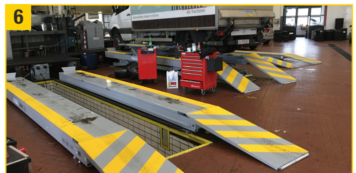
6 Fertig! Staubtrocken in ca. 1 Std. (bei 20 °C) Ausgehärtet und belastbar nach ca. 48 Std. (bei 20 °C)