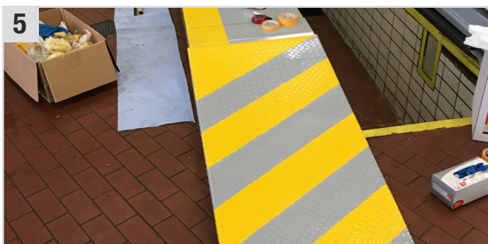
5 Anschließend SunCore Pro (Abdeckband) entfernen.