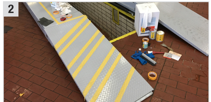
2 SunCore Pro (Abdeckband) auf die gewünschten Stellen aufkleben.