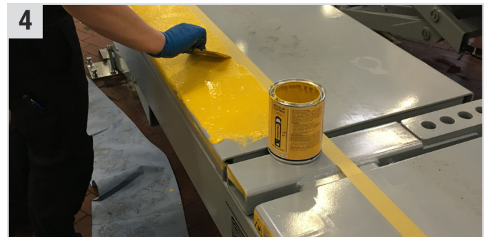
4 Antislip Coating (Antirutsch-Beschichtung) mithilfe unserer Kyoto Car Black (Karo Kunststoff-Spachtel) oder unserem Abbeiz-Pinsel Nylon auftragen.