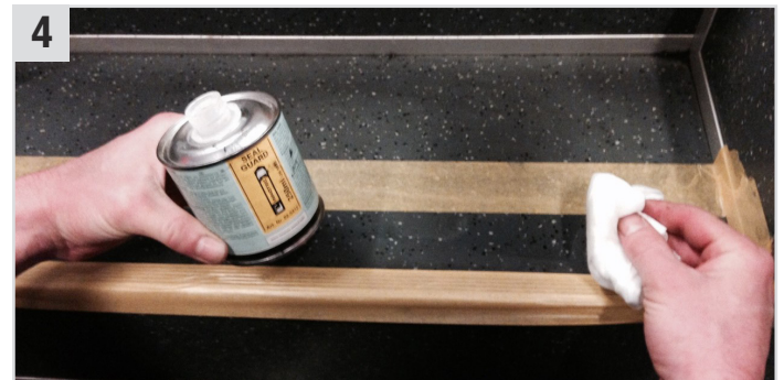
4 Seal Guard (Transparenter Primer) auf Multi Wipes (Universaltuch) geben und eine dünne Schicht auftragen - ca. 15 Min. ablüften lassen.