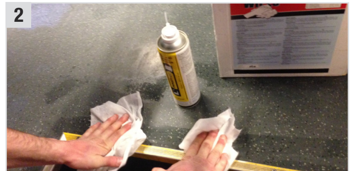
2 PVC Boden mit Seal and Bond Remover (Klebstoff- & Dichtmassenentferner) und Multi Wipes (Universaltuch) gut reinigen/entfetten und ca. 5 Min. ablüften lassen.