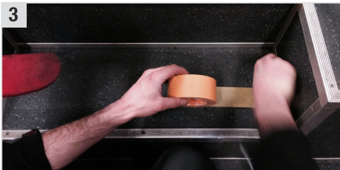
3 SunCore Pro (Abdeckband) auf die gewünschten Stellen aufkleben.