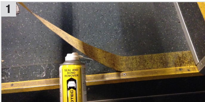
1 Die alten und beschädigten Strukturfolien bzw. den Klebefilm mit Seal and Bond Remover (Klebstoff- & Dichtmassenentferner) entfernen.