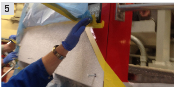
5 Anschließend das SunCore Pro (Abdeckband) sofort entfernen. Nass-in-nass überlackierbar nach 30 Min. bis 4 Std.