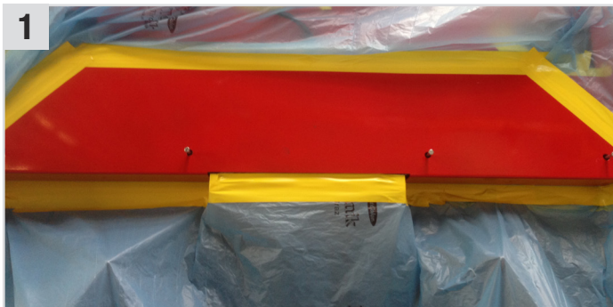
1 SunCore Pro (Abdeckband) an den gewünschten Stellen aufkleben.