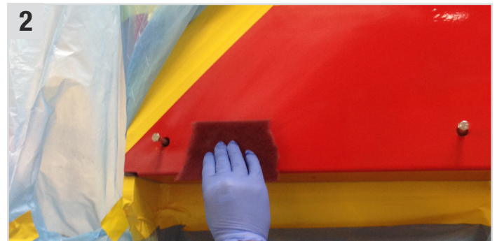
2 Untergrund mit Shine P 600 (Schleifvlies) aufrauen.