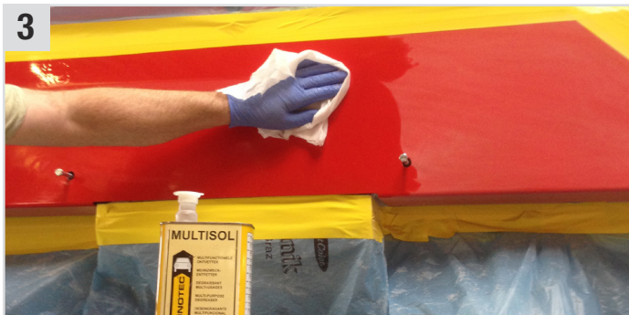
3 Anschließend die zuvor aufgeraute Fläche mit Multisol (Mehrzweck-Entfetter) und Multi Wipes (Universaltuch) gut reinigen (ca. 5 bis 10 Min. ablüften lassen) und trocken nachwischen.