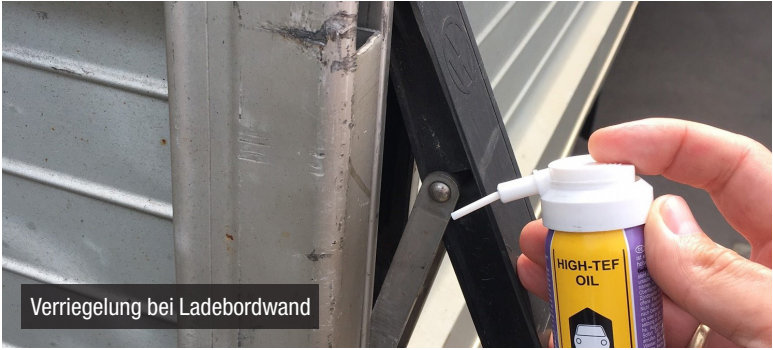
Verriegelung bei Ladebordwand